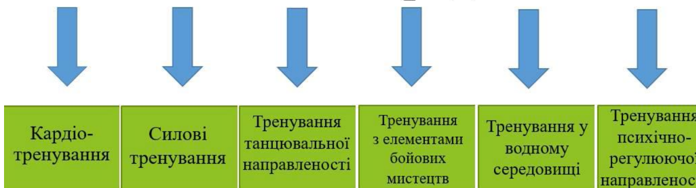
Мал. 2. Класифікація фітнес-гібридів