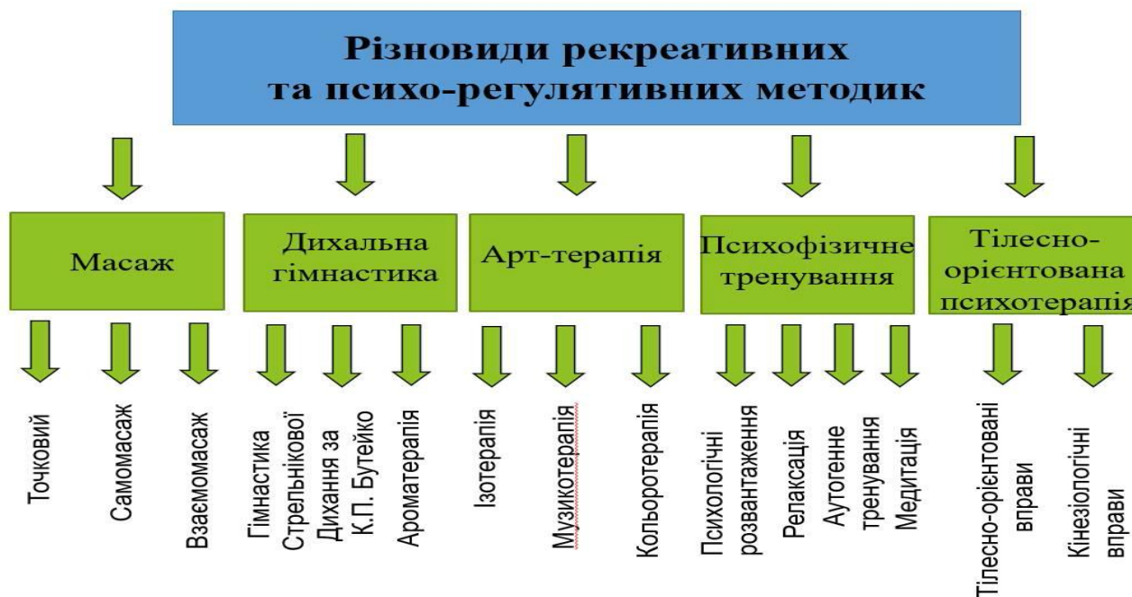
Рис. 5. Класифікація засобів психоемоційної регуляції.

нерідко – агресія. Збереження психологічного здоров'я учня є безперервний профілактичний процес, який передбачає своєчасне попередження психоемоційного перенавантаження. Для цього є певний набір технік чи прийомів, які дають змогу володіти собою в критичних ситуаціях та звільнитись від негативних емоцій (Мал. 5).