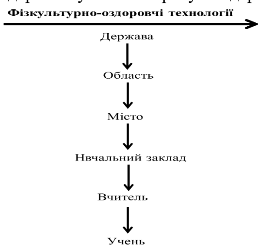
Мал. 1. Впровадження фізкультурно-оздоровчих технологій рівнів «держава-учень».

Тривале використання командно-стройових методів і засобів фізичного виховання в закладах освіти, що було орієнтоване переважно на виконання певних нормативів фізичної підготовленості, призвело до несприйняття учнями існуючих форм фізичного виховання. Останні 20-25 років можна охарактеризувати бурхливий розвиток у світі новітніх технологій фізичного виховання фізкультурно-оздоровчого напрямку. На жаль, багато чого із надбань у цій галузі не знайшло належного місця у практиці фізичного виховання в сучасній Україні. Впровадження у школі технологій рівнів «держава-учень» потребує модернізації всіх проміжних ланок (мал. 1).